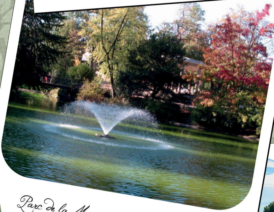
Parc de la Maison Blanche (Clamart)